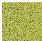
VERDE PASTO PE-05