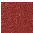
ROJO COLONIAL PE-02